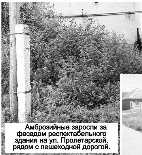
Амброзийные заросли за фасадом respectable здания на ул. Пролетарской, рядом с пешеходной дорогой.

— Да вот, цветок какой-то вырос. Посмотри, какой красивый!