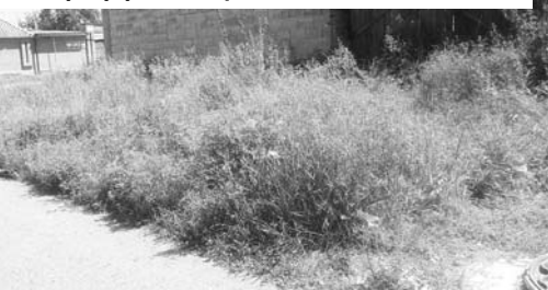
На углу улиц Партизанской и Титова.

Действительно, молодое растение амброзии полыннолистное не вызывает неприязни. Ее ажурные шелковисто-бархатные листья красивы и приятны на ощупь. Она очень похожа на полынь, но мягка и элагантна. Но присутствие ее рядом с жилищем и на участке — крайне опасно. Во всем мире это растение известно, прежде всего, как сильнейший аллерген. Слезящиеся глаза, заложенный нос, головная боль, — это еще не худшие последствия встречи с цветущей амброзией. Ее пыльца способна вызвать развитие астмы.